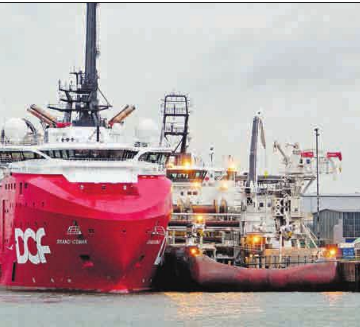
flyterigg og tre offshore-skip i havnen i Rotterdam i Nederland i fjor sommer.