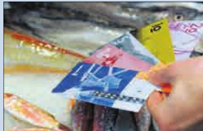
TRE EUSKO, TAKK: Valutaen eusko, som brukes noen steder i fransk Baskenland er et eksempel på alternativ valuta.