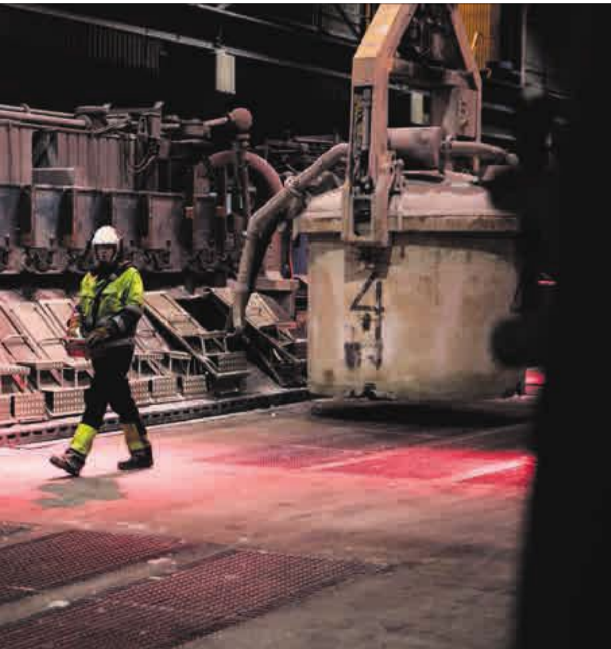
er kan gi den kraftkrevende industrien dårligere vilkår. Her er aluminiumsverket i Mosjøen.

Statnett tar over eierskapet. På Eide virker det som om han mener et eiermessig skifte vil si at Northconnect ikke blir bygd.