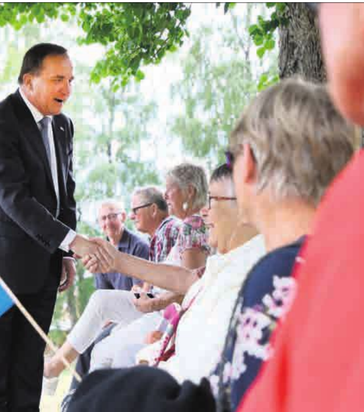
sysselsettingsvekst enn den norske.