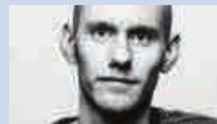
Roman Eliassen PENGER

Vi bruker to typer penger i dag. Den ene er kontanter: sedler og mynt. Disse lages av staten, ved sentralbanken. Den andre er kontopenger. Disse skapes av private banker når de utsteder lån.